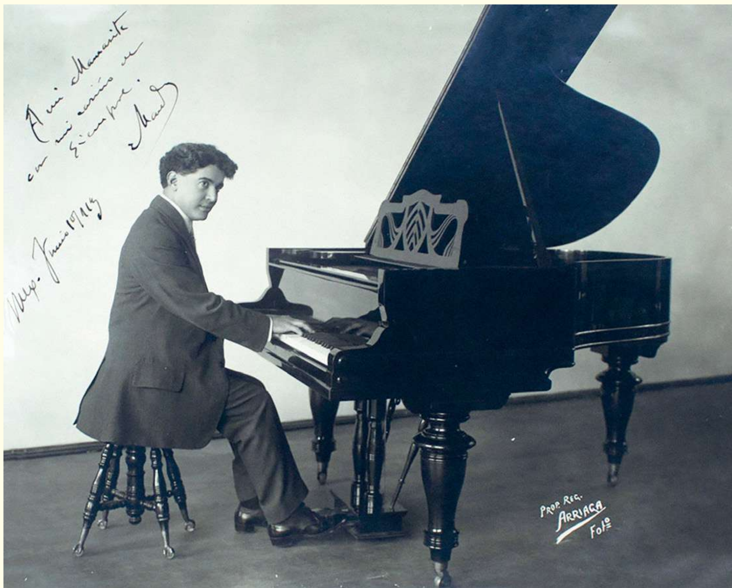
Página anterior: [23] Carlos Chávez escribiendo música. Izquierda: [24] Manuel M. Ponce tocando el piano. Ca. 1910.

Manuel M. Ponce (1882-1948). Nació en Fresnillo, Zacatecas. A los nueve años compuso su primera obra pianística. En 1900 se trasladó a la Ciudad de México para estudiar en el Conservatorio y en 1904 viajó a Europa. Estudió en Bolonia con Luigi Tochi y en Berlín con Martin Krauze. En 1912 tocó el estreno de su Concierto para piano y orquesta con la Orquesta Sinfónica de México, dirigida por Julián Carrillo. En 1914 aparece su álbum de canciones mexicanas, la más famosa Estrellita , compuesta en 1912.