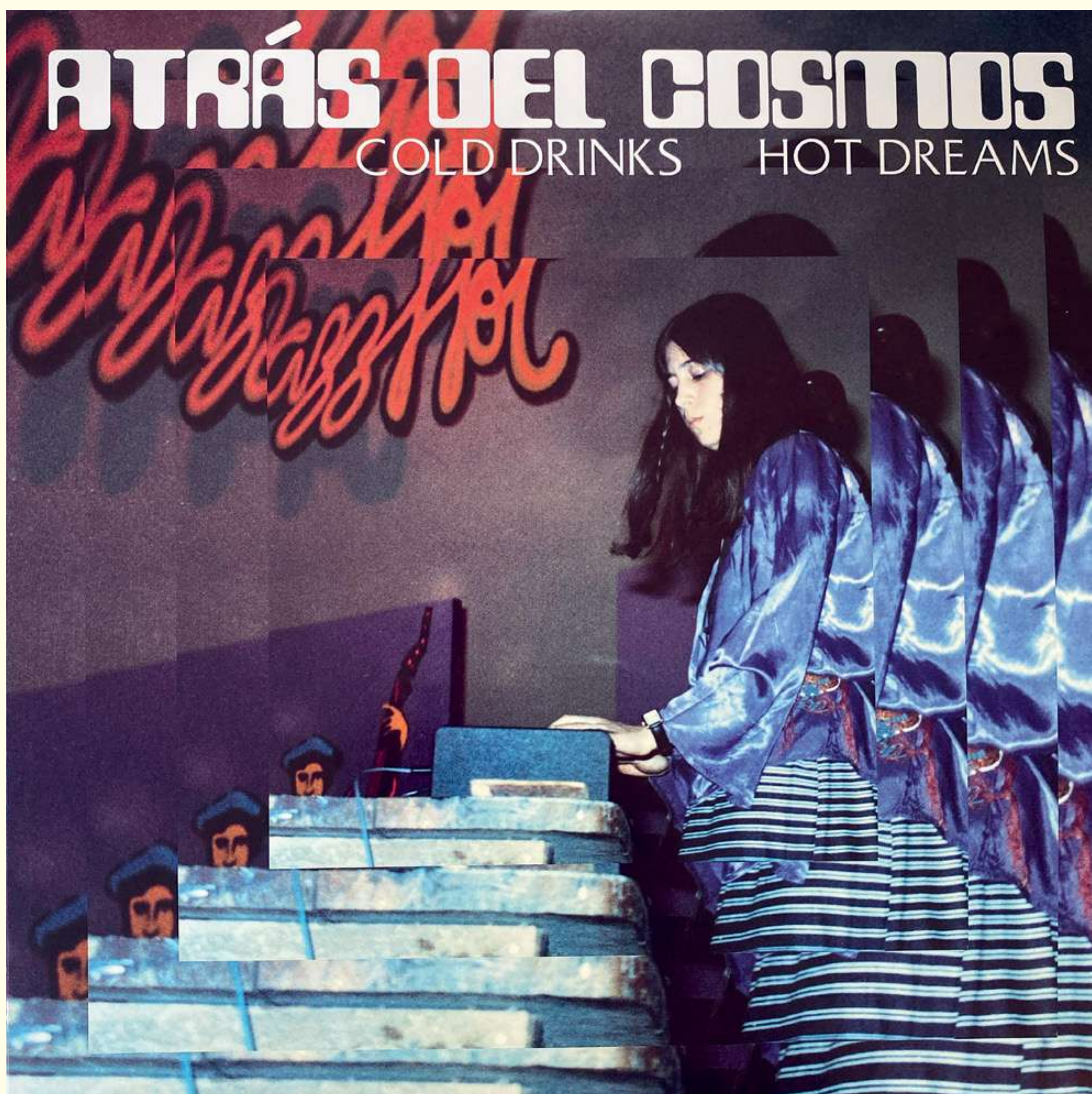
[28] Cold Drinks, Hot Dreams. Atrás del Cosmos. Portada del álbum publicado recientemente por Blank Forms Editions.

electrónica. Ya con un papel protagónico, empiezan a surgir más mujeres en diferentes disciplinas artísticas.