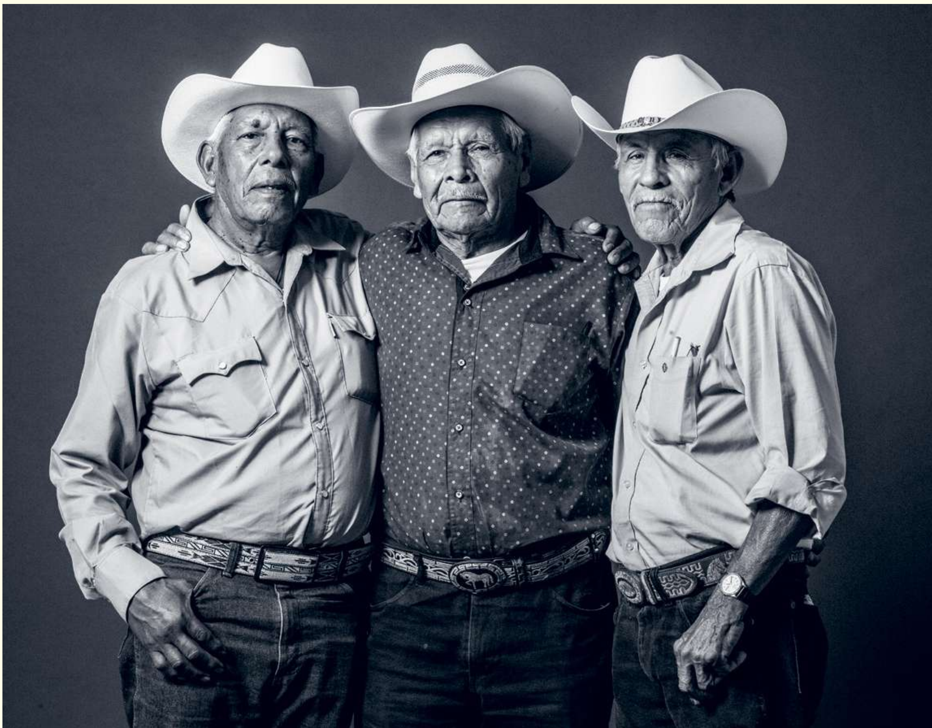
Página anterior: [17] Tuba. C.W. Moritz (atribuido) Ca. 1855. Izquierda: [18] Los Cardencheros de Sapioriz. Durango. 2017.

La conformación de los numerosos y muy diversos géneros tradicionales que se escuchan todavía en el México de nuestros días es el resultado de un largo y continuo proceso de mestizaje. Durante los tres siglos de la Colonia y en las décadas posteriores al movimiento de Independencia llegaron a nuestro país una gran cantidad de géneros (con sus respectivas características melódicas, rítmicas, armónicas), así como una diversidad de instrumentos y técnicas de construcción e interpretación de uso corriente en Europa. Estos elementos musicales fueron fusionándose entre sí, y con los ya existentes, adquiriendo fisonomías particulares en las distintas regiones de México hasta llegar a ser lo que hoy son y conocemos.