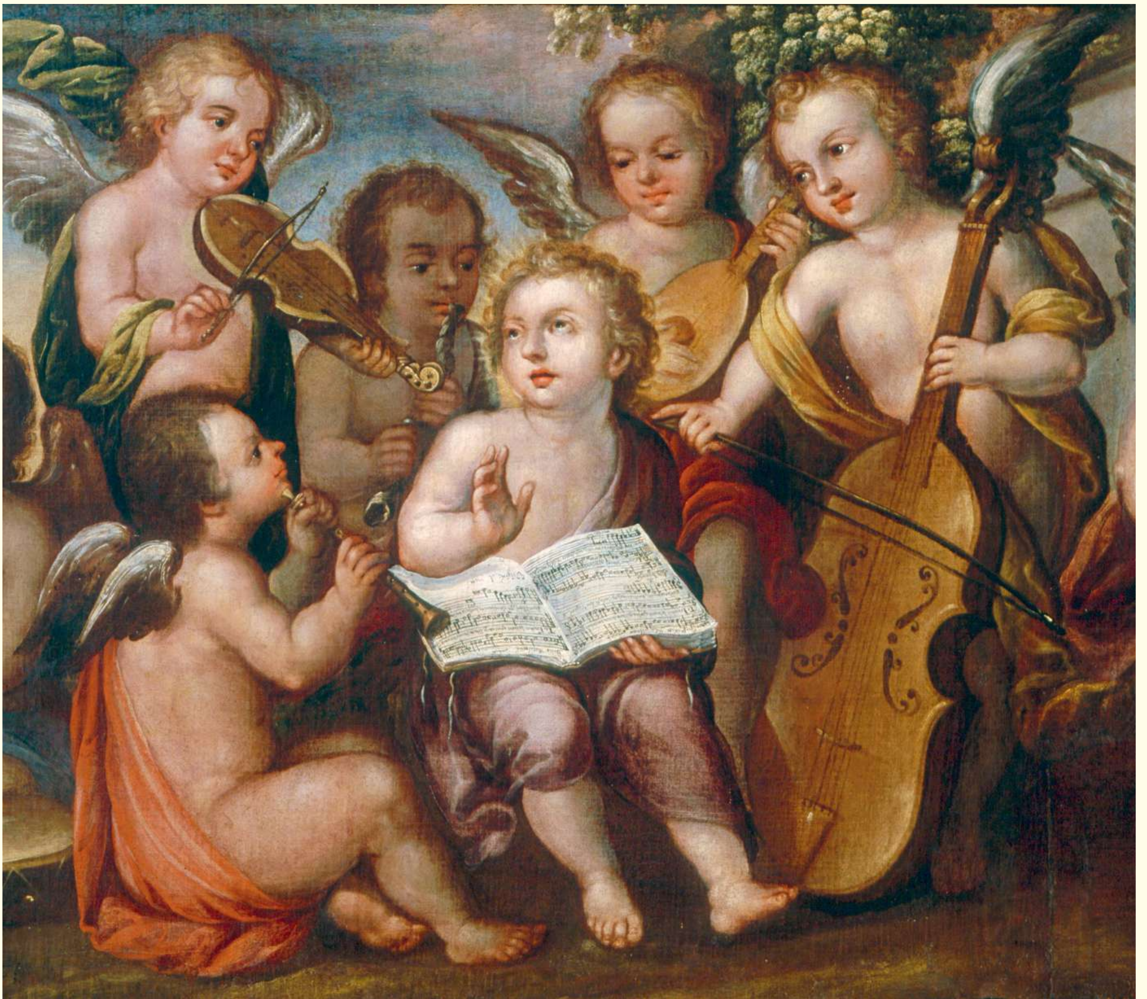
[7] Niño Jesús con ángeles músicos . Juan Correa (atribuido). S. XVIII. Óleo sobre tabla. Museo Nacional de Arte.

y 1807. De 1802 procede el edicto que el virrey Berenguer y Marquina publicó en forma de bando, prohibiéndolo. En una declaración de 1813, parte de la averiguación del Santo Oficio acerca de la conspiración de Valladolid, se dice que «lo más del día lo ocuparon en juegos y algunos ratos en baile y algo de canto, habiéndose ejecutado una marcha de Corral, Las mañanitas y unas boleras con letra indiferente». Se añade que Las mañanitas era composición insurgente.