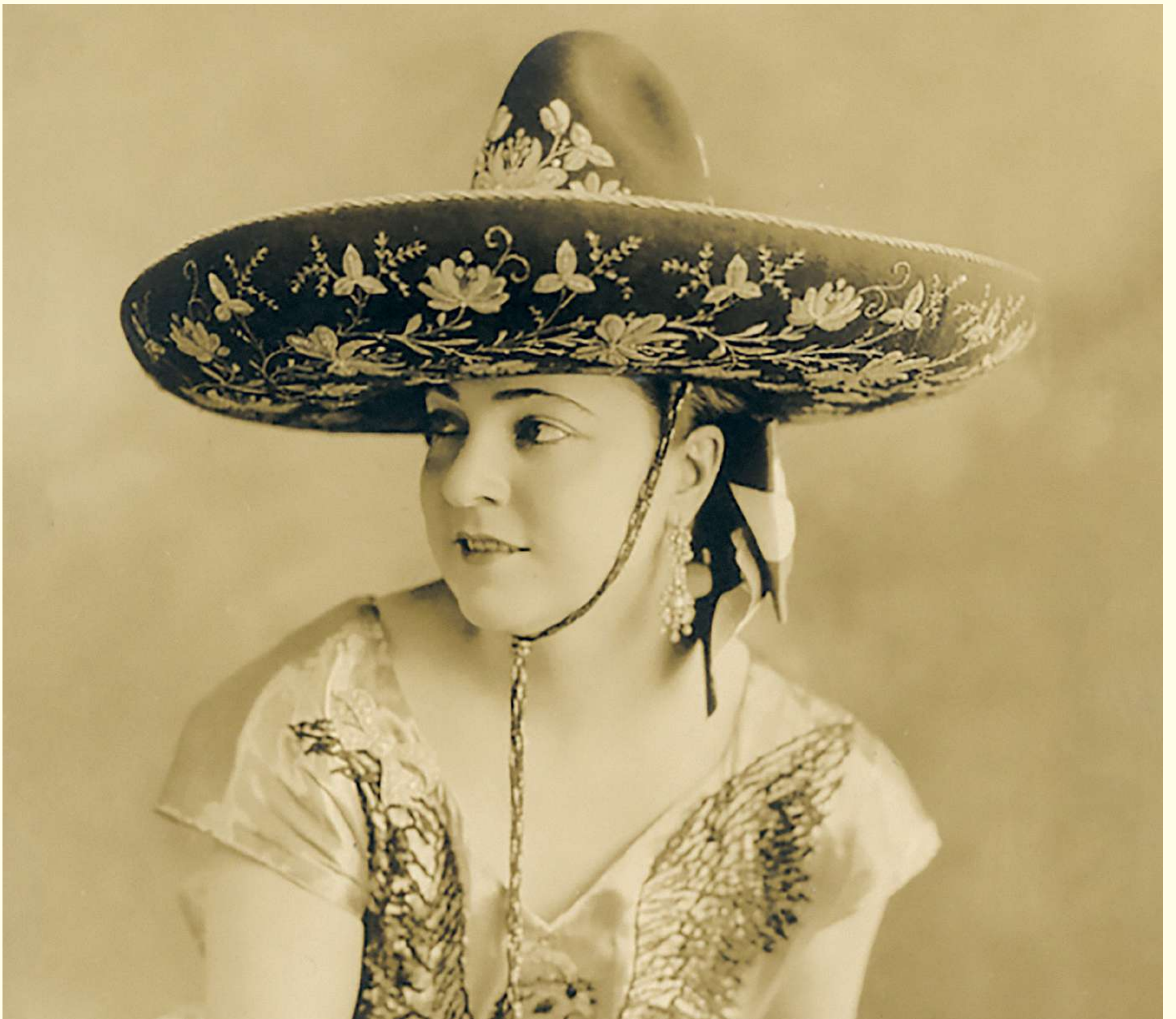
Página anterior: [11] La poblanita , cuarta colección de canciones. José Guadalupe Posada, grabador. Vanegas Arroyo, editor. Ca. 1900. Arriba: [12] María Conesa (1892-1978). Ca. 1925.