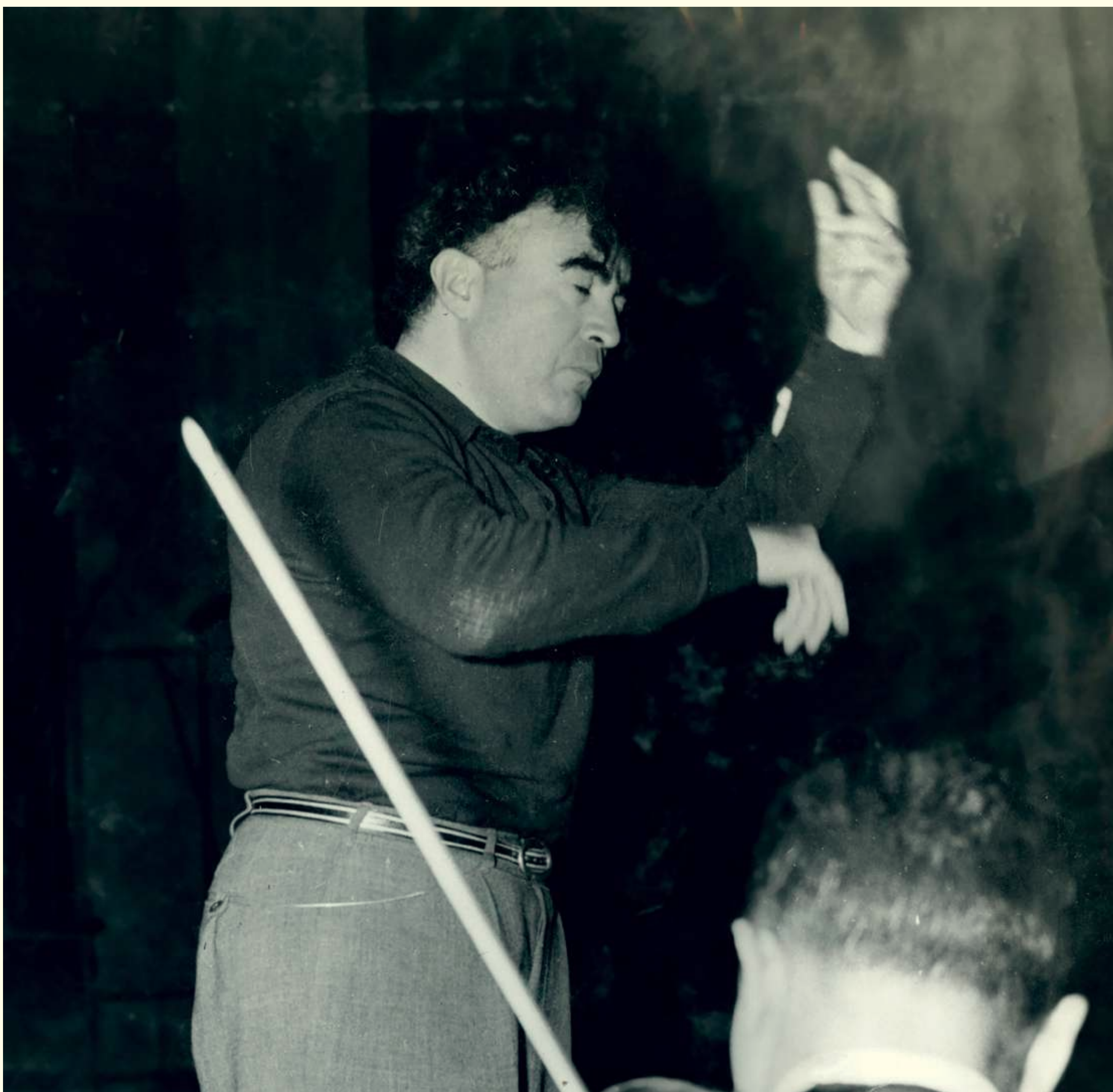
[25] Carlos Chávez dirige en un ensayo. Ca. 1937.

para formarse en la St. Edwards University de Austin y, dos años después, en el Chicago Music College, donde estudió violín. Regresó a México en 1929 invitado por Carlos Chávez y se presentó como solista de la recién creada Orquesta Sinfónica de México con el Concierto en sí menor de Mozart. Fue nombrado maestro de violín y de música de cámara en el Conservatorio y asumió la subdirección de la citada orquesta, a la que renunció en 1935 por diferencias con Chávez.