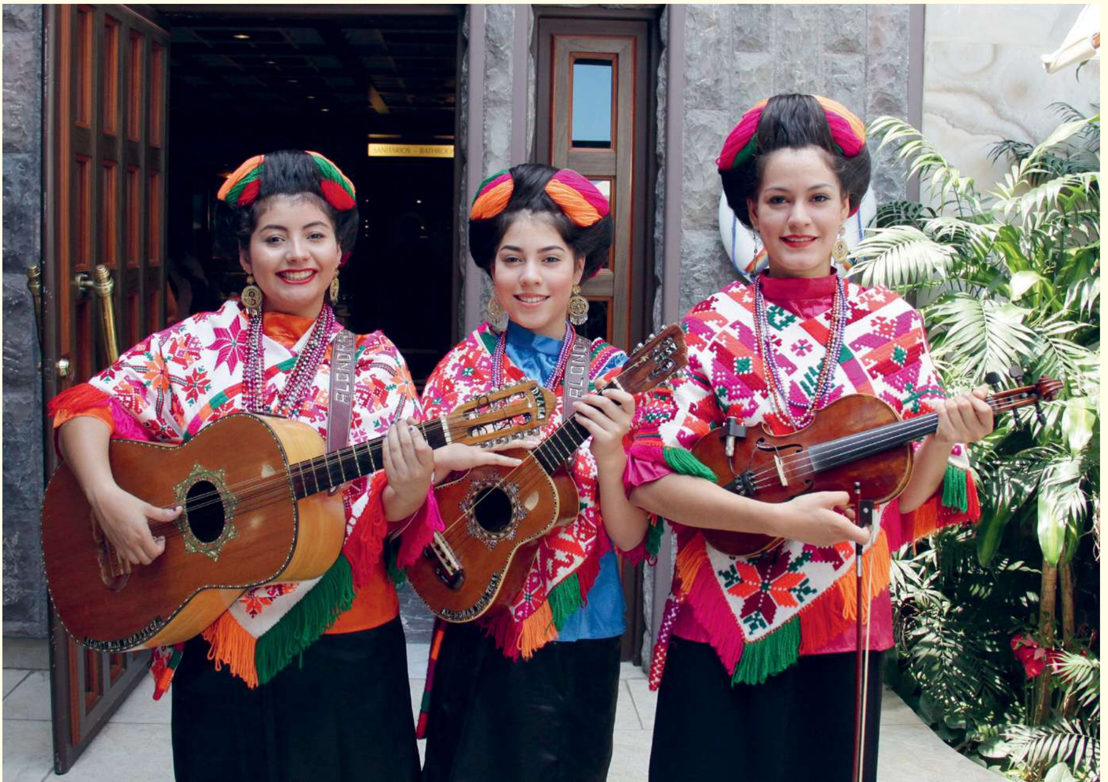
[19] Ensemble juvenil huasteco. 2016.

tardíamente, con el surgimiento de la industria minera y el auge del ferrocarril, que propiciaron fuertes oleadas migratorias. En la música nortea se distinguen dos grandes ramas que tienden a fusionarse: el corrido y los géneros bailables centroeuropeos, polkas y redovas sobre todo.