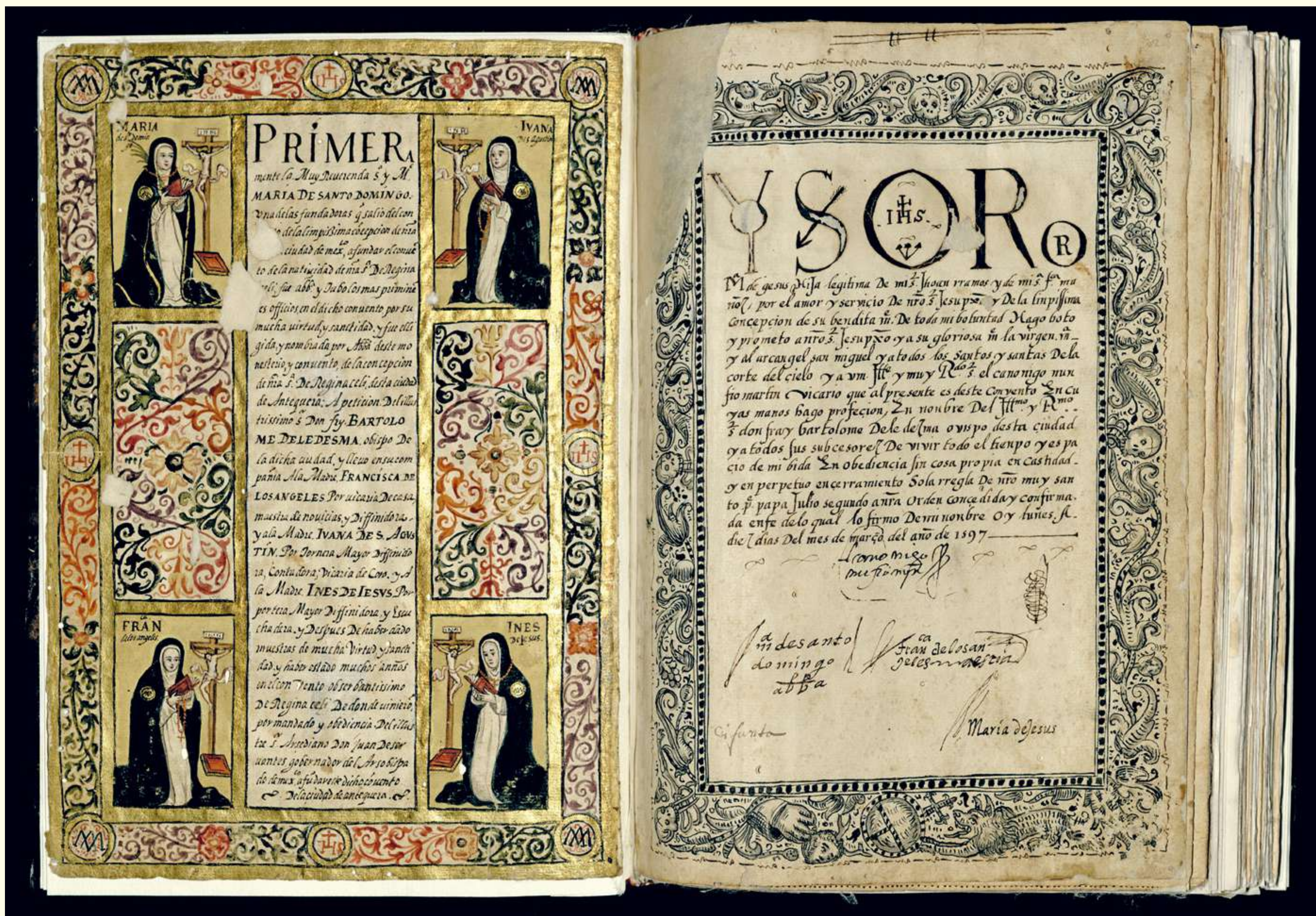
Página anterior: [5] Catedral de Puebla. Lorenzo de Becerril. Ca. 1875. Impresión de época, 15.5×10 cm. DeGolyer Library, Southern Methodist University. Arriba: [6] Regina Coeli, libro de coro. Centro INAH Oaxaca.

La conquista española desplazó a la música de las culturas nativas americanas, pero en cambio dio nacimiento a nuevas formas de expresión. América se convirtió en una extensión de la cultura ibérica: en nuestro continente se proyectaron la lengua, la religión, las costumbres cotidianas, las comidas, las fiestas. También las letras, la arquitectura, la poesía, el teatro y la música.