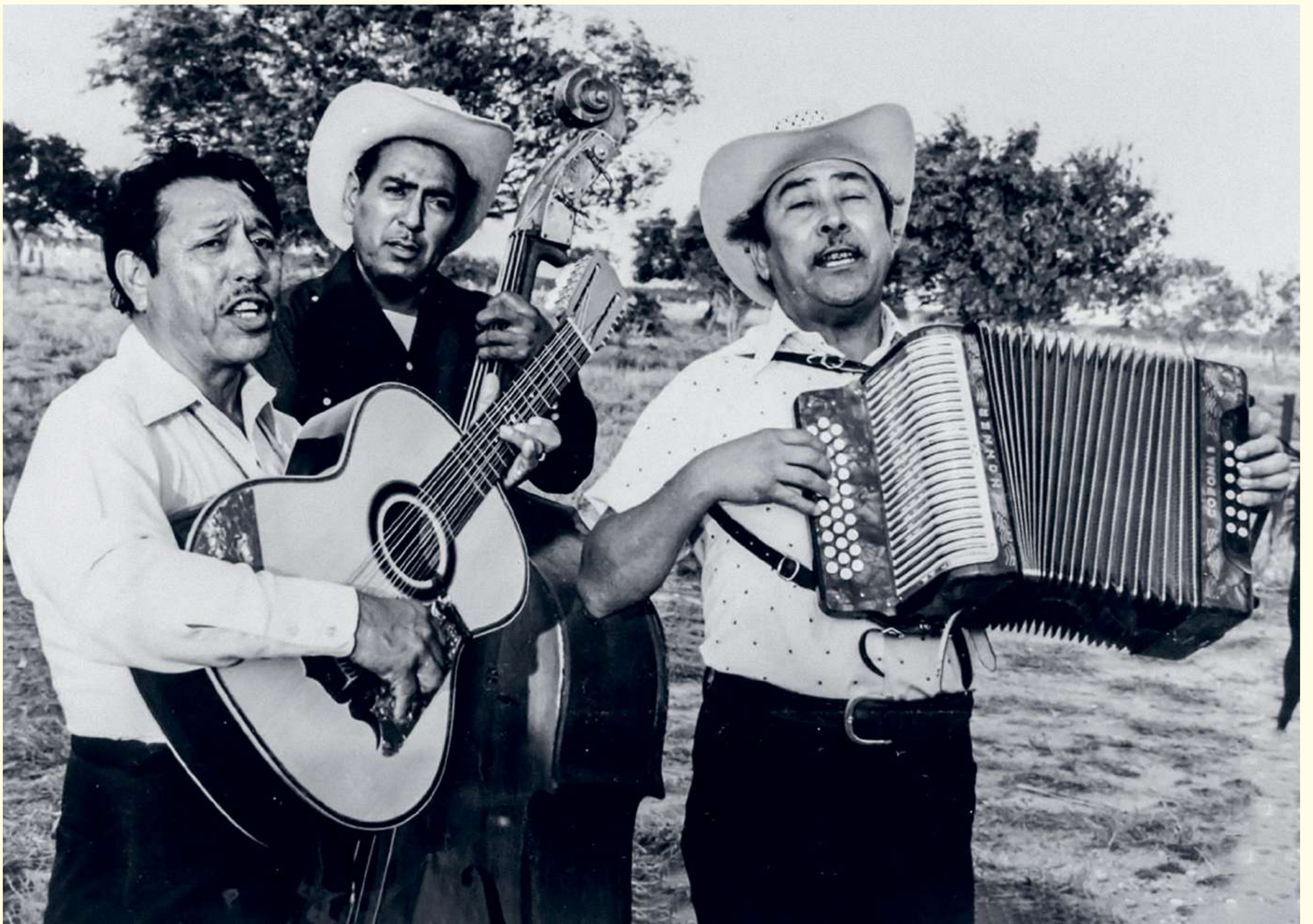
[16] Los Alegres de Terán. Ca. 1950.

combinación natural de varios géneros en el México independiente, principalmente del romance tradicional, la canción lírica en coplas, y el romance vulgar. Esta compleja confluencia de géneros y estéticas fraguan el corrido tradicional mexicano, que se consolida a principios del siglo xx por el auge de su modalidad épica —el corrido de la Revolución— y por su difusión masiva en los nuevos medios: la radio, el cine y los discos. Sin embargo, el corrido en tanto poema narrativo existía desde las últimas décadas del siglo xix, dando cuenta de noticias sobre bandoleros sociales y transgresores de la ley, así como de temas novelescos, relacionados con las pasiones humanas: celos, engaños, traiciones, venganzas.