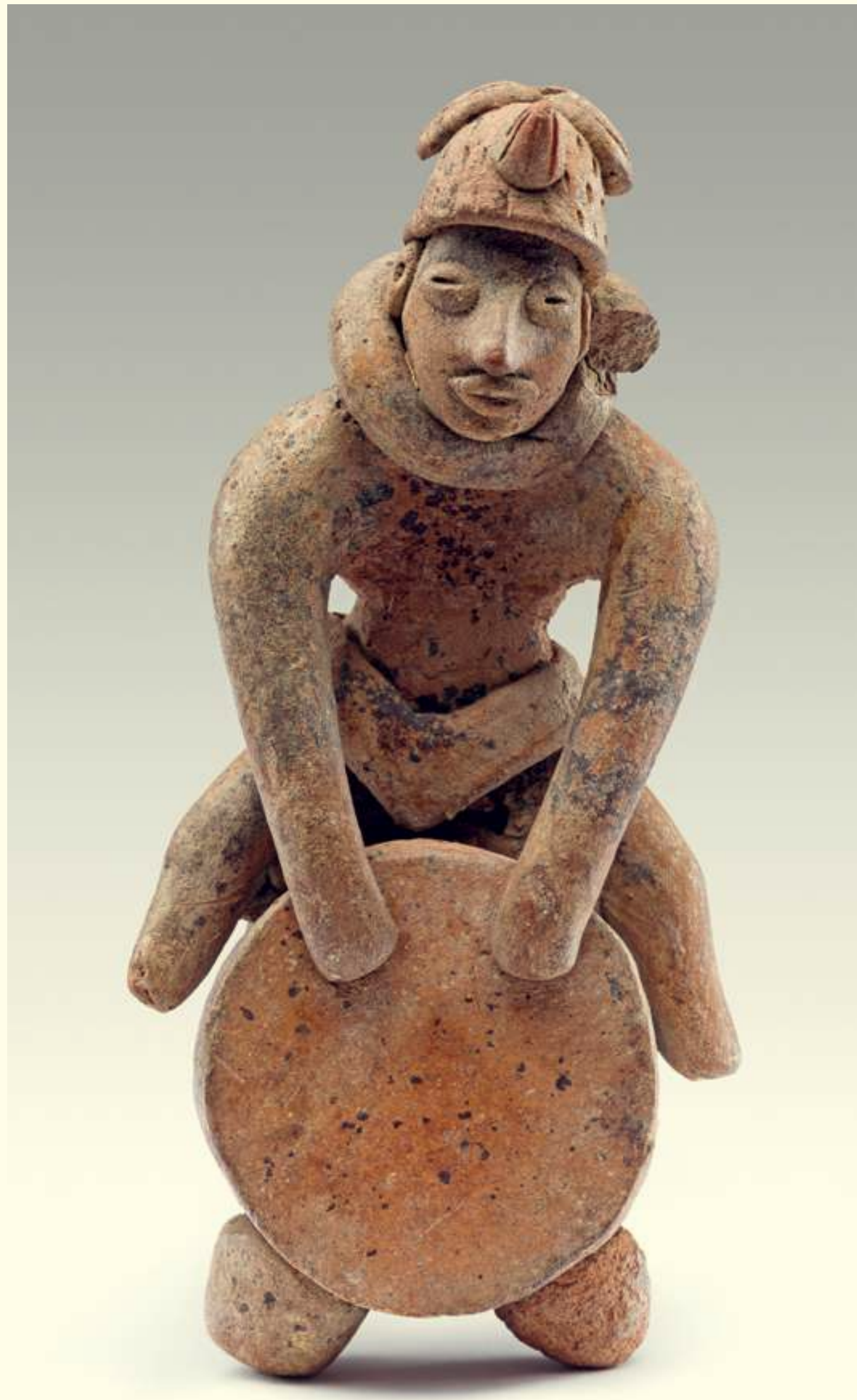
Página anterior: [1] Xochipilli, señor de las flores, la fertilidad, la poesía y el canto entre los mexicas. Tlalmanalco, Estado de México. Ca. 1250. Izquierda: [2] Figura antropomorfa con flauta cilíndrica. Chupícuaro, Guanajuato. Ca. 200. Derecha: [3] Figura antropomorfa tocando el huéhuatl . Colima. Ca. 200.

¿De qué formas estuvo presente la música en el universo de la cultura náhuatl? En su origen, fue un regalo de los dioses. Luego acompañó su existencia, sus fiestas, sus bailes, sus cantos y sus plegarias. La música fomentó su florecer a través de los siglos hasta el día en que el pueblo náhuatl y su cultura parecieron morir. Mas, contra lo que pudo pensarse, a pesar de adversidades sin cuento, el pueblo náhuatl perdura en muchos lugares. Se escucha y se escribe una nueva palabra. El pueblo náhuatl sigue amando la música y, puesto de pie, quiere avizorar la vida con esperanza y coraje.