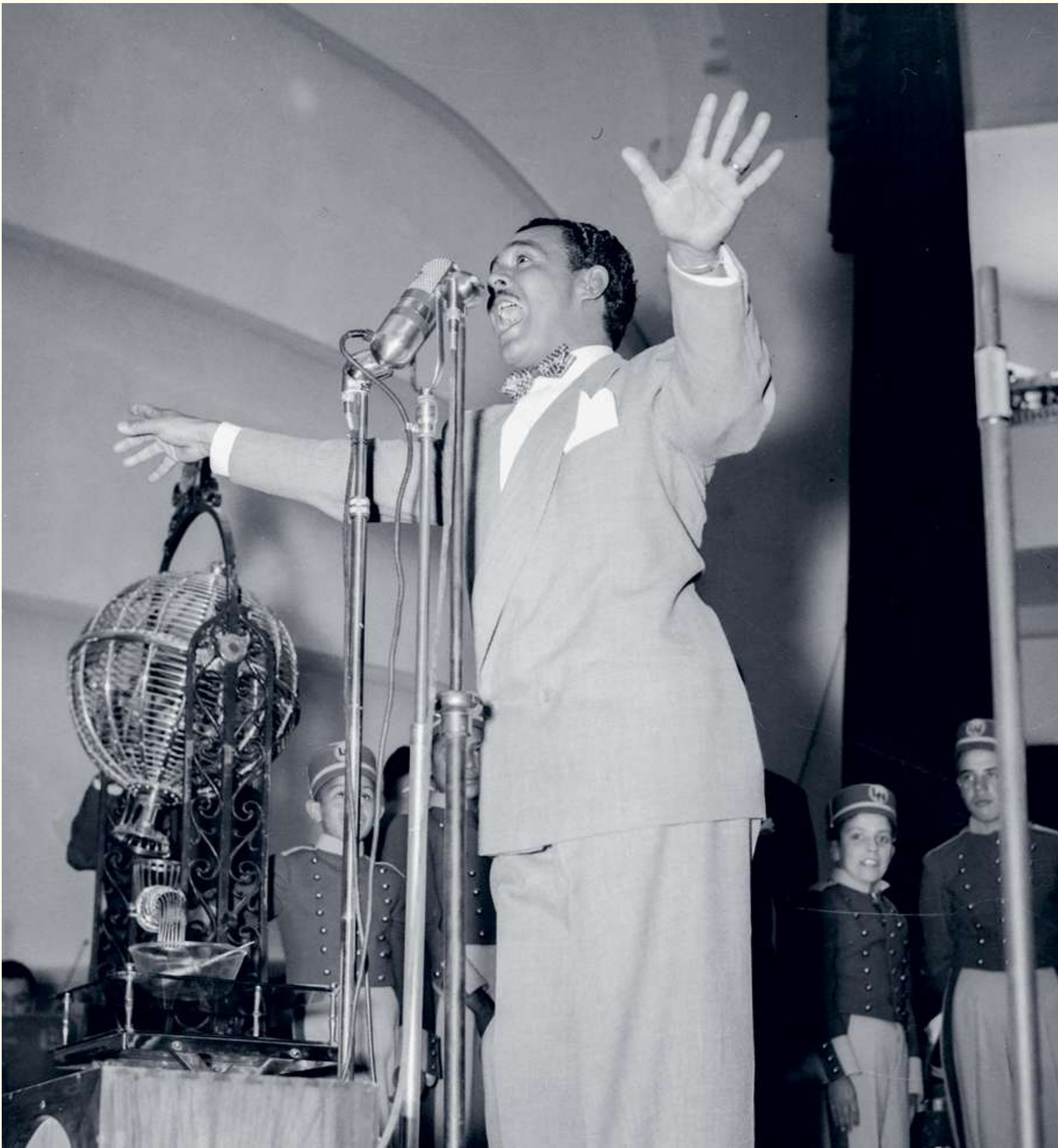
[22] Dámaso Pérez Prado (1916-1989), el máximo exponente del mambo en México. Ca. 1950.

Pérez Prado no solo revolucionó el sonido del mambo a través de la influencia de las grandes bandas norteamericanas, también forjó parte de la idiosincrasia e identidad del mexicano de aquella época: le compuso un mambo a las dos universidades más importantes del país (la UNAM y el IPN), otro a los ruleteros, uno más a las Lupitas, e incluso hizo referencia al clasismo con La niña popof .