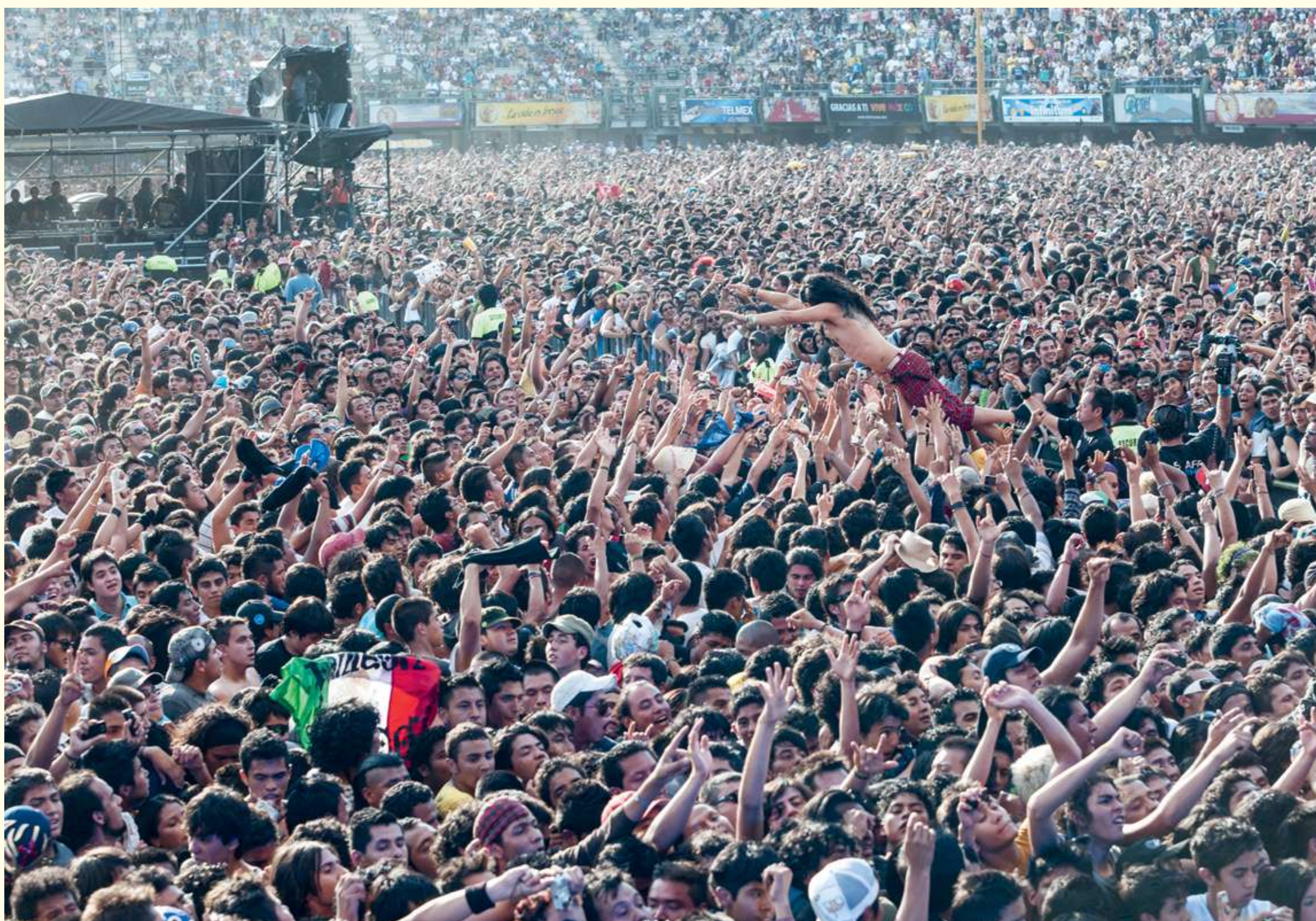
[31] Panteón Rococó. Vive Latino 2010.

rock estaban de nuevo en los medios masivos de comunicación, varios de ellos vendiendo cientos de miles de copias de sus álbumes.